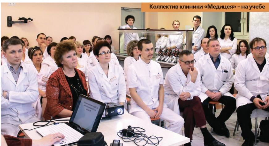
Коллектив клиники «Медицея» - на учебе